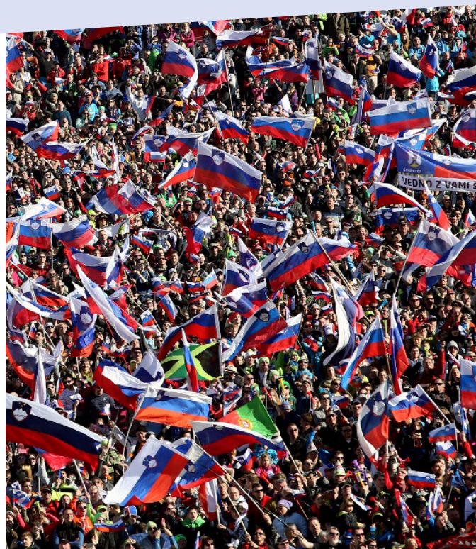
Navijači v Planici.

Praznik je bil sprva znan kot dan vrnitve Primorske k matični domovini in je bil kot državni praznik potrjen jeseni 2005. Z novelo zakona o praznikih in dela prostih dnevih, ki jo je Državni zbor sprejel 23. oktobra 2024, je bil praznik preimenovan v dan priključitve Primorske k matični domovini.