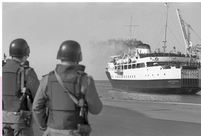
Vojaki Jugoslovanske ljudske armade zapuščajo slovensko ozemlje.