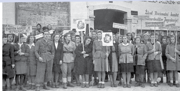
Mladina s transparenti na proslavi osvoboditve Beograda, Črnomelj.

OF je bila ustanovljena 26. aprila 1941 v hiši književnika Josipa Vidmarja v Ljubljani, kjer so se sestali predstavniki različnih političnih in družbenih skupin. Sprva je združevala štiri skupine: Komunistično partijo Slovenije, krščanske socialiste, Sokole (jugoslovansko telovadno društvo) in kulturne delavce. Kasneje se je razširila in povezala širši del slovenskega prebivalstva v boju proti okupatorjem. Pred Vidmarjevo hišo od leta 1951 stoji tudi spomenik, ki ga je zasnoval arhitekt Jože Plečnik.