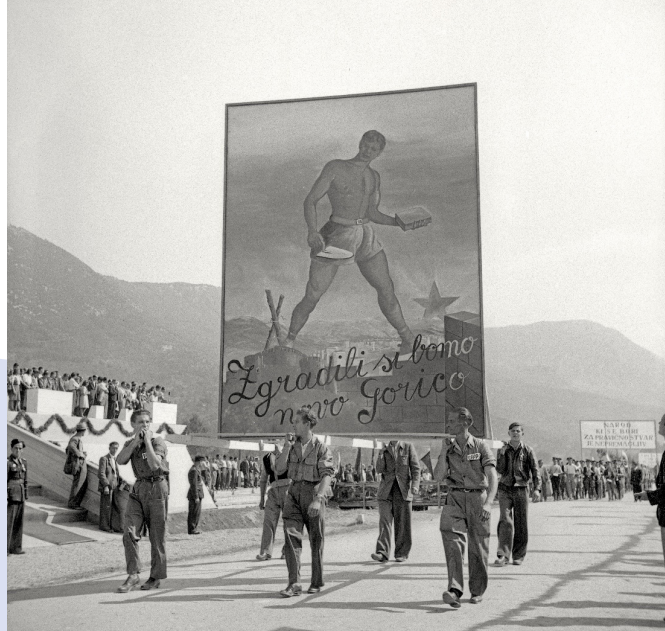
Festival ob priključitvi Primorske k matični domovini.

Sloenci, ki so v obdobju med obema vojnama in med drugo svetovno vojno živeli na tem območju, so bili dolga leta izpostavljeni italijanizaciji, fašističnemu nasilju ter zatiranju slovenskega jezika in kulture. Pariška mirovna pogodba je zato pomenila pomembno