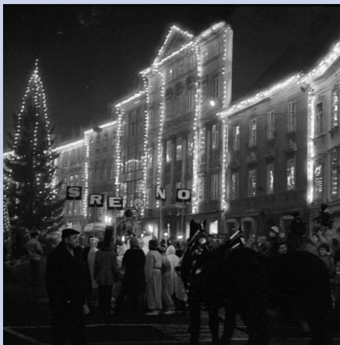
Praznično okrašena mestna hiša, Ljubljana, december 1989.

Imena praznikov in posebnih datumov se po Slovenskem pravopisu pišejo z malimi začetnicami, razen tistih, ki so izpeljana iz osebnih lastnih imen, na primer Prešernov dan.