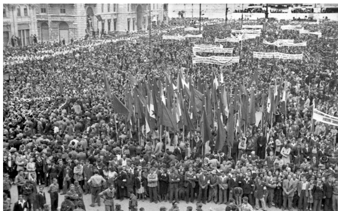
Prvomajska parada.

1. in 2. maj sta v Sloveniji državna praznika in dela prosta dneva. Gre za mednarodni praznik dela, ki ga praznujejo ljudje po vsem svetu. Praznik izvira iz bojev delavskega razreda za boljše delovne pogoje, krajši in omejen delovni čas ter spoštovanje delavskih pravic. Je eden izmed redkih praznikov, ki se je po svetu enotno razvijal. Nastal je iz solidarnosti do žrtev delavskih nemirov v Chicagu leta 1886 zaradi odpusta delavcev ter močnega političnega gibanja socialnih demokratov.